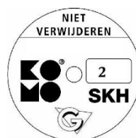
geschikt voor weerstandsklasse 2